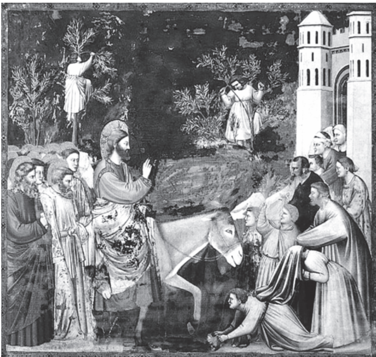
Giotto: Jézus bevonulása Jeruzsálembe (XIV. sz.)

De itt vagyunk, de megvagyunk, nézzük, hogy nő a völgyi búza s a szőlővirág hogy kígyózik fölrepedt, égő homlokunkra. Így éneklünk s az ördöglábú asztal lesz majd a nagydobunk – parasztok és Jézus király, egymást karolva mulatunk.