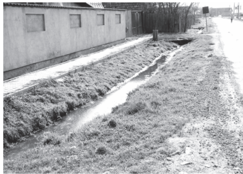
A szennyvíz egyszerűen a sáncokba folyik, ezért sürgős a hálózat megépítése