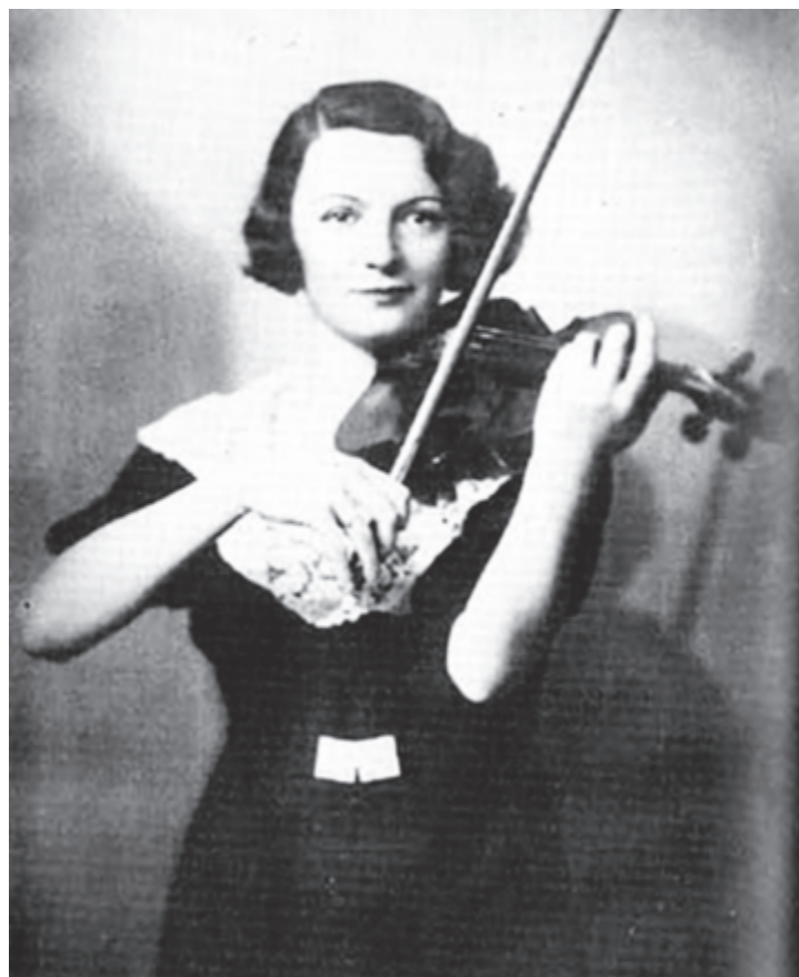
Fehér Ilona (1901-1988)

A jubileumi év tiszteletére a fesztivál programját átadhatja Kodály Zoltán öröksége, művei felcsendülnek a koncertek és a mesterkurzusok mellett a hegedűversenyen is. A program megvalósulását az Emberi Erőforrások Minisztériuma támogatta.