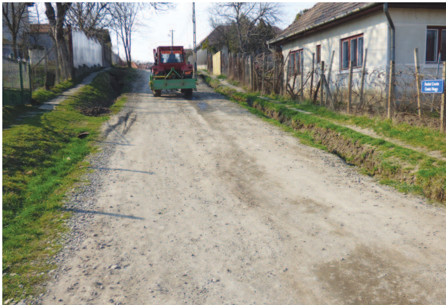
Egyeseknek az utcák aszfaltozása sürgősebb, hasznosabb volna, mint a csatornázás