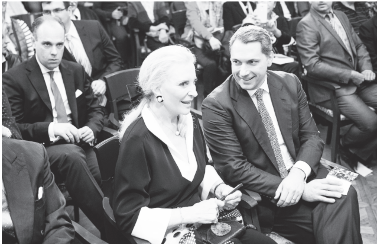
Lázár János, a Miniszterelnökséget vezető miniszter és Mihály kenti herceg magyar származású felesége, Mária Krisztina Anna hercegné, leánykori nevén Marie von Reibnitz író A szerelmes királynő – Négy ország uralkodója című történelmi regénye bemutatóján a fővárosi Petőfi Irodalmi Múzeumban 2017. április 5-én.

A kenti herceg felesége, Marie-Christine von Reibnitz a brit uralkodói család egyetlen magyar származású tagja, gróf Szapáry Frigyes unokájaként rendszeresen látogat Magyarországra. Eddig hat könyve jelent meg angol nyelven.